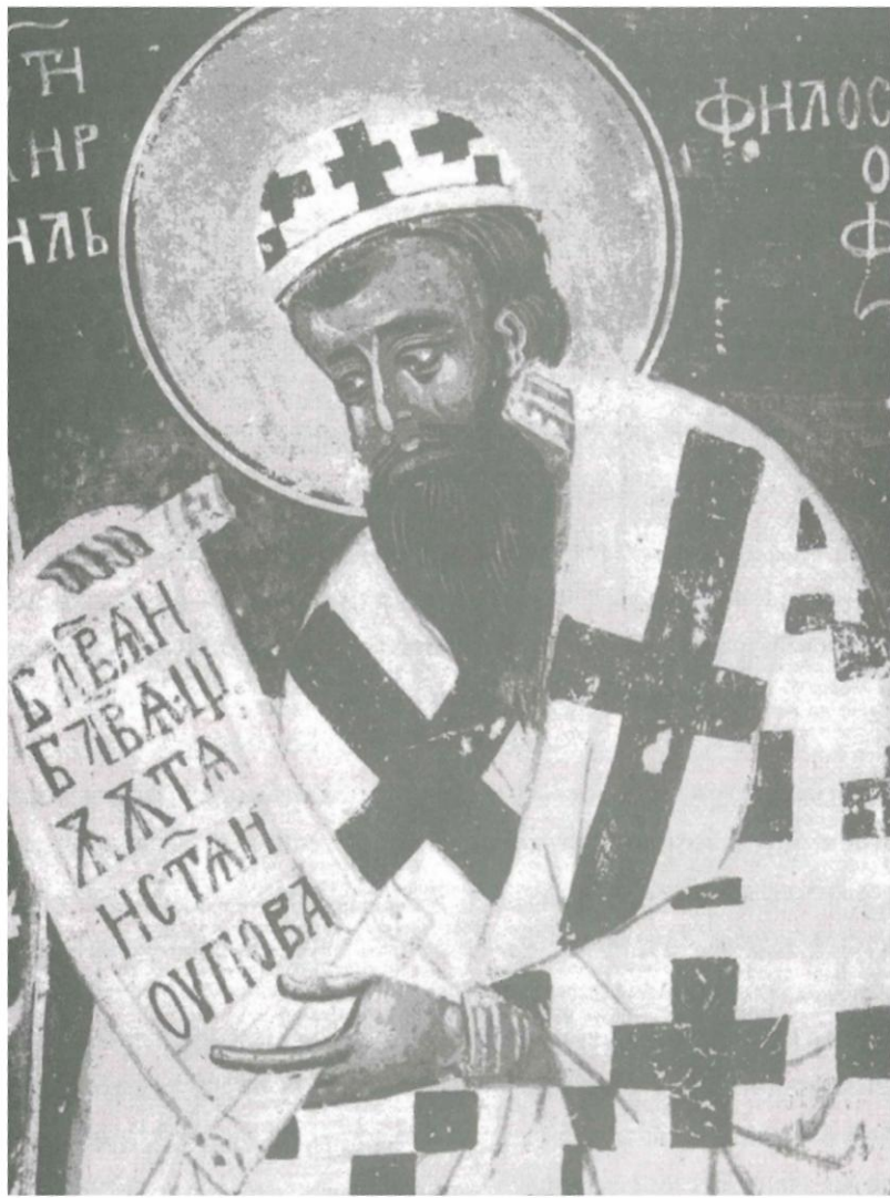
Κύριλλος, ο φιλόσοφος (Τοιχογραφία 13 ου – 14 ου αιώνα στον Ναό του Αγίου Πέτρου, περιοχή Σόφιας, Βουλγαρία)