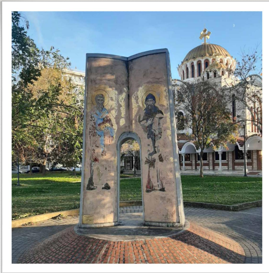
Ιερός Προσκυνηματικός Ναός Αγίων Κυρίλλου και Μεθοδίου, ο οποίος θεμελιώθηκε από τον μακαριστό Μητροπολίτη Θεσσαλονίκης Παντελεήμονα Β΄ Χρυσοφάκη το 1981 στην Θεσσαλονίκη