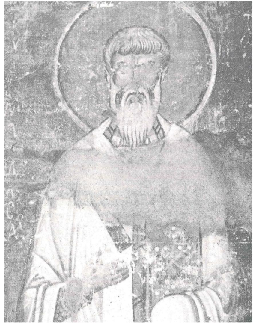
Ο Άγιος Κύριλλος (Τοιχογραφία της Αγίας Σοφίας Αχρίδας, 1045)