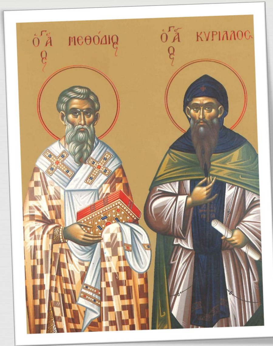
Η Πανεύφημη Θεσσαλονίκη: πατρίδα του Κυρίλλου και Μεθοδίου