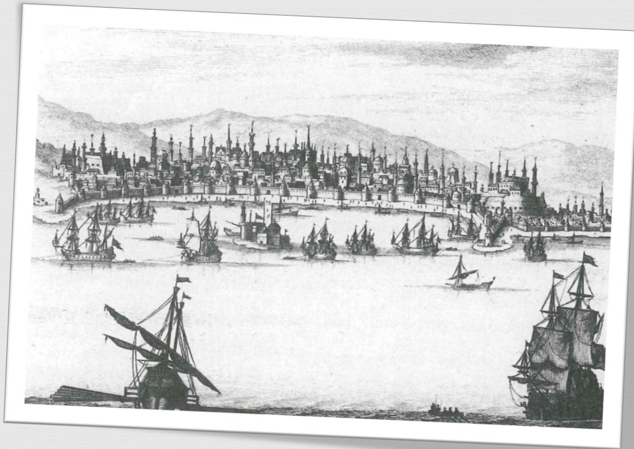
Απεικόνιση της Θεσσαλονίκης (Ολλανδική χαλκογραφία, 1688)